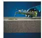
Säure- und chemikalienbeständig