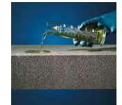
Säure- und chemikalienbeständig